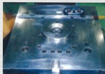
金型 (ゼラストフィルム使用)