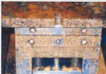
金型 (ゼラストフィルム未使用)